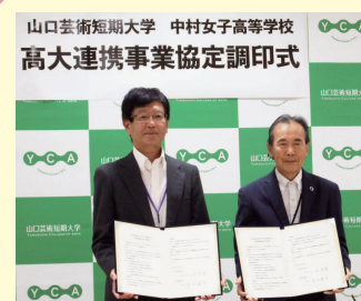
大学と高校の枠組みを超え、専門性の高い知識・技能を身につけた保育士養成を目指して、協定が結ばれました。

高校と短大の連携により計5年間で、多様化するニーズに応えられるハイレベルな幼稚園教諭・保育士養成を行います。 高大連携協定により、高校での成績等、一部条件がありますが、希望者は高校入学と同時に卒業後の短大への進学が可能となります。幼稚園教諭や保育士などの資格の確実な取得への扉が開きます。 高校では福祉分野についても学んでおり、健康な子どもの他、福祉が必要とされる保育・教育分野へも自信をもって就職できます。