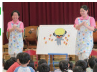
保育園実習で「おねえちゃん先生」 こどもの輝く瞳は保育士の宝物です