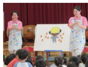
保育園実習で「おねえちゃん先生」 子どもの輝く瞳は保育士の宝物です

近年、保育士のニーズは高まると共に、求められる知識・技能も高度化しています。高大連携協定は、高校と短大の5年間連携して教育を行うことにより、豊かな感性と創造性の育成に向けた学生及び生徒の資質・能力の向上を図ることを目的としています。